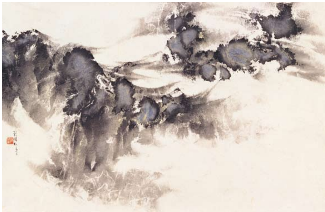
〔雲深不知處〕，1963，墨彩紙本，53.6×85.8 cm 香港藝術館收藏

這件完全以毛筆書寫水墨完成的作品，作者在左右揮灑的筆觸中，造就了一個逐次升騰的折線動態，予人以山峰連綿的豐富意象。畫山畫水、畫雲畫煙，或許不是作者創作的初衷，也不是他的目的，但山、水、雲、煙，卻在作品中自然的浮現。這或許和他苦難的童年是在山林水鄉中度過有關，而他一生熱愛爬山，在大學畢業前後的幾年間，幾乎已經爬遍了台灣的各座名山，也有一定影響。