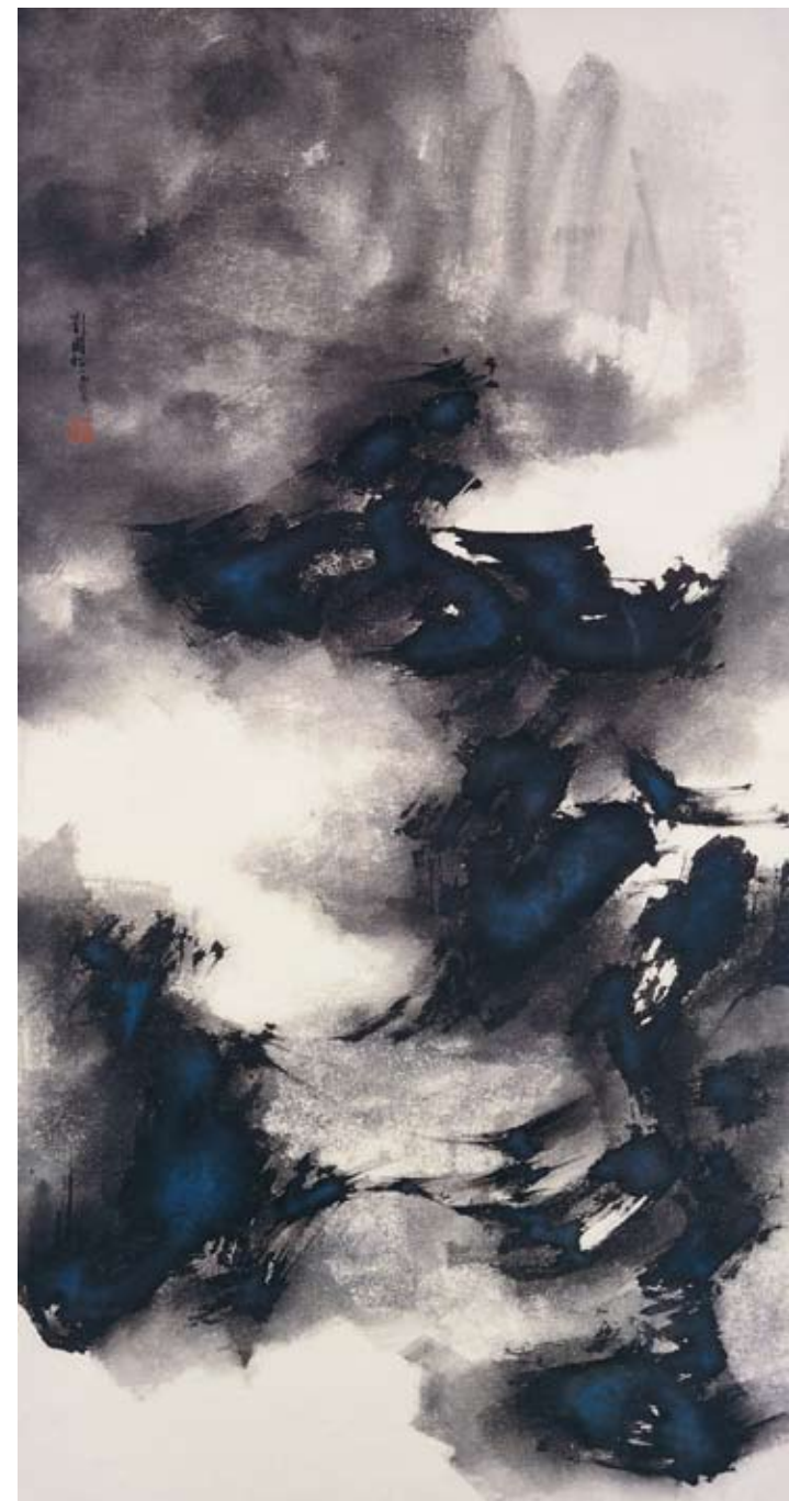
〔五月的意象〕 1963，水墨紙本，111.5×56 cm