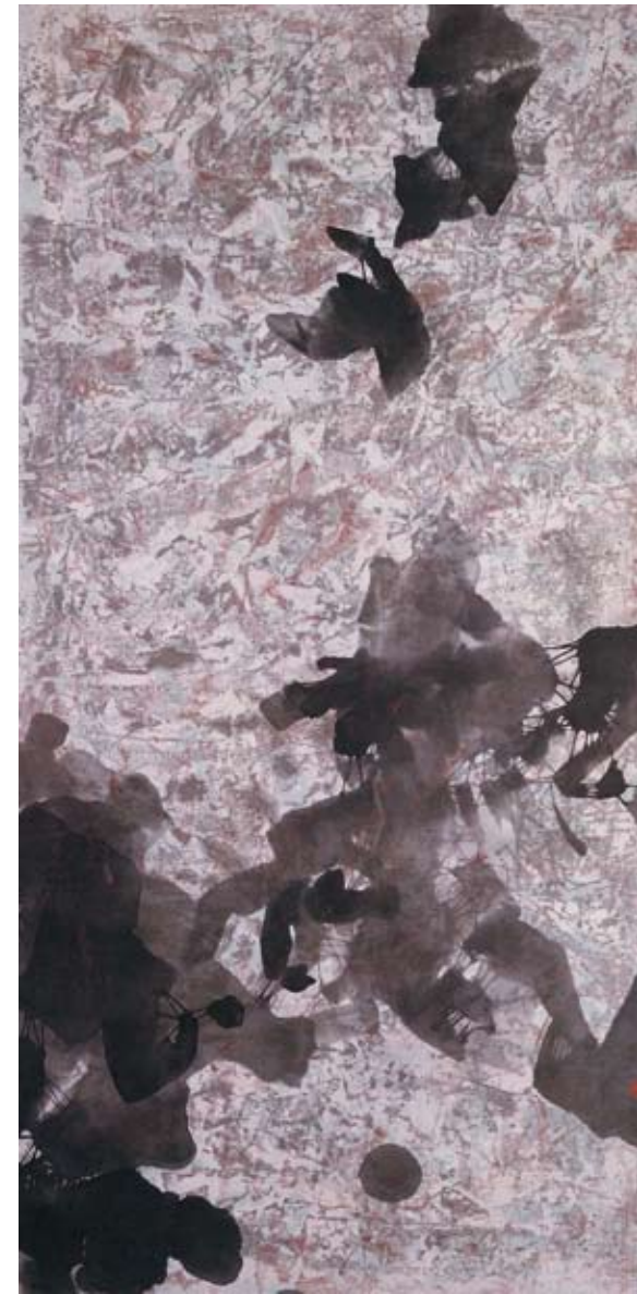
〔追逐者〕 1962，水墨紙本，136×69 cm