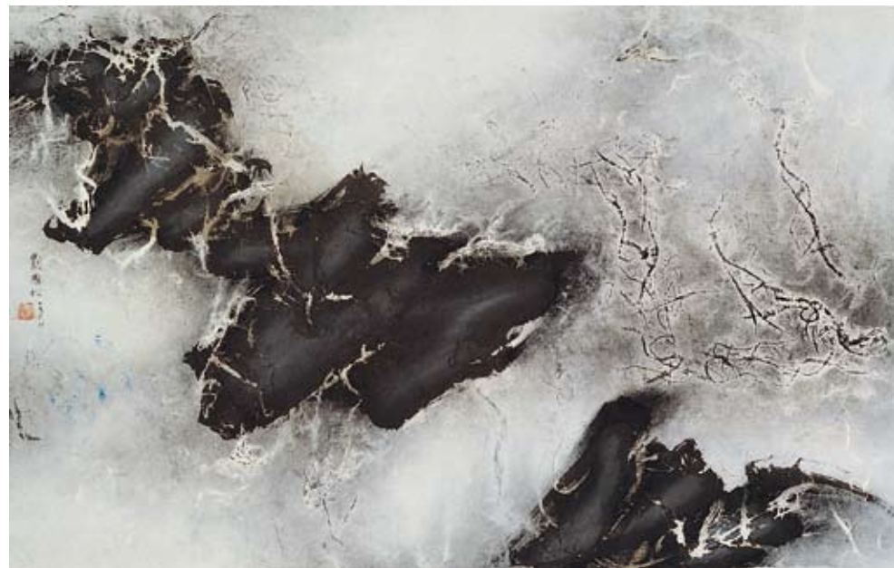
〔灑落的山音〕 1964，墨彩紙本，54×94.5 cm 私人收藏

余光中指出劉氏作品中黑白相映的效果，是「畫黑留白，不畫如畫，黑固甚美，白尤多姿，黑呼白應，如魂附身。」充分地把握了東方玄學中的機運與二元性。余光中形容劉國松這個時期的作品，在構圖上已