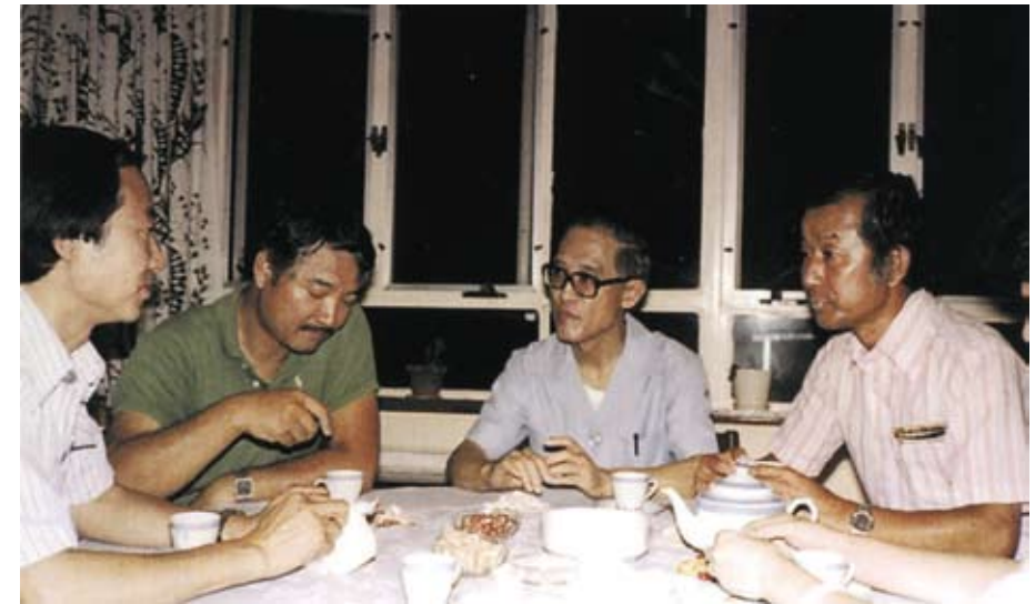
攝於香港中文大學余光中家（1979）。左起：楊世彭、許以祺、余光中、劉國松。

這是一個文藝復興、風雲際會的年代，一些對藝文現代化有理想的年輕人，幾乎不約而同地聚集在一起。之後，他們乾脆約定每個月有一次固定的聚會，彼此交換心得，也相互激勵。這個特殊的藝文雅集，主要的成員有：繪畫的劉國松、文學的余光中、音樂的許常惠、美學的姚一葦、戲劇的俞大綱、舞蹈的劉鳳學、雕刻的楊英風，和建築的王大閎……等。此外，還有一些不定時加入討論的藝文人士。