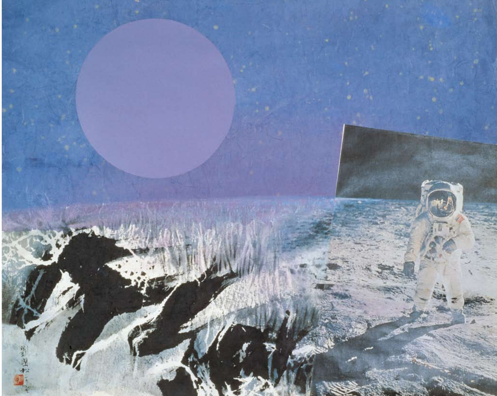
〔月球漫步〕 1969，墨彩拼貼紙本，69×85 cm