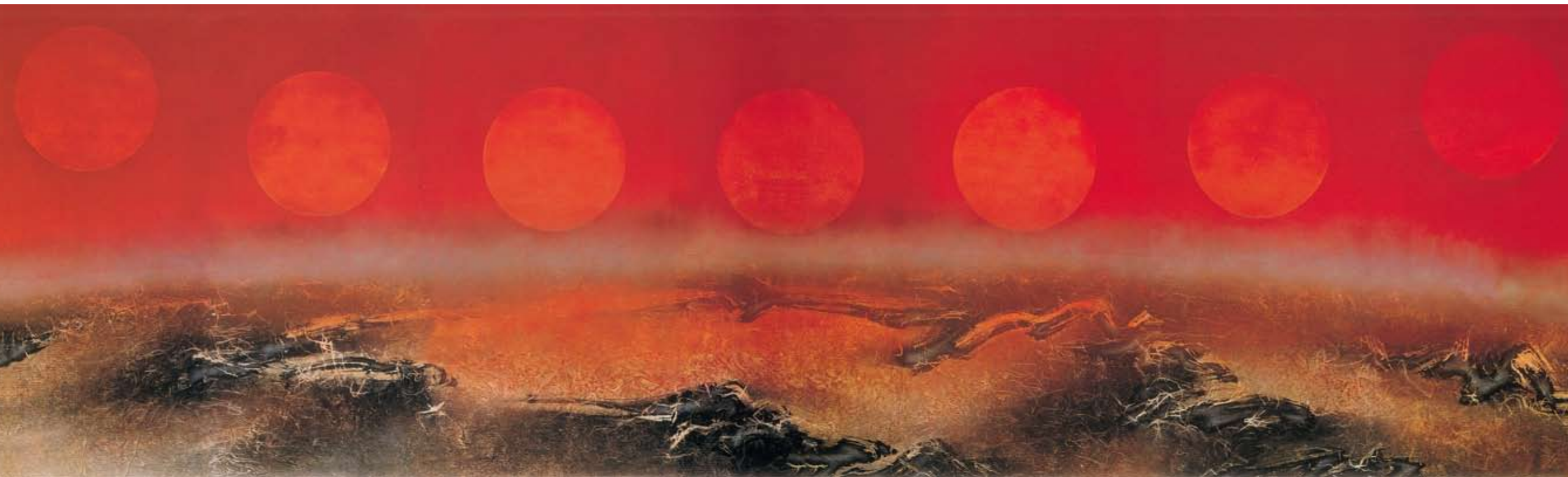
〔午夜的太陽〕，1972，墨彩拼貼紙本，153×533 cm，私人收藏