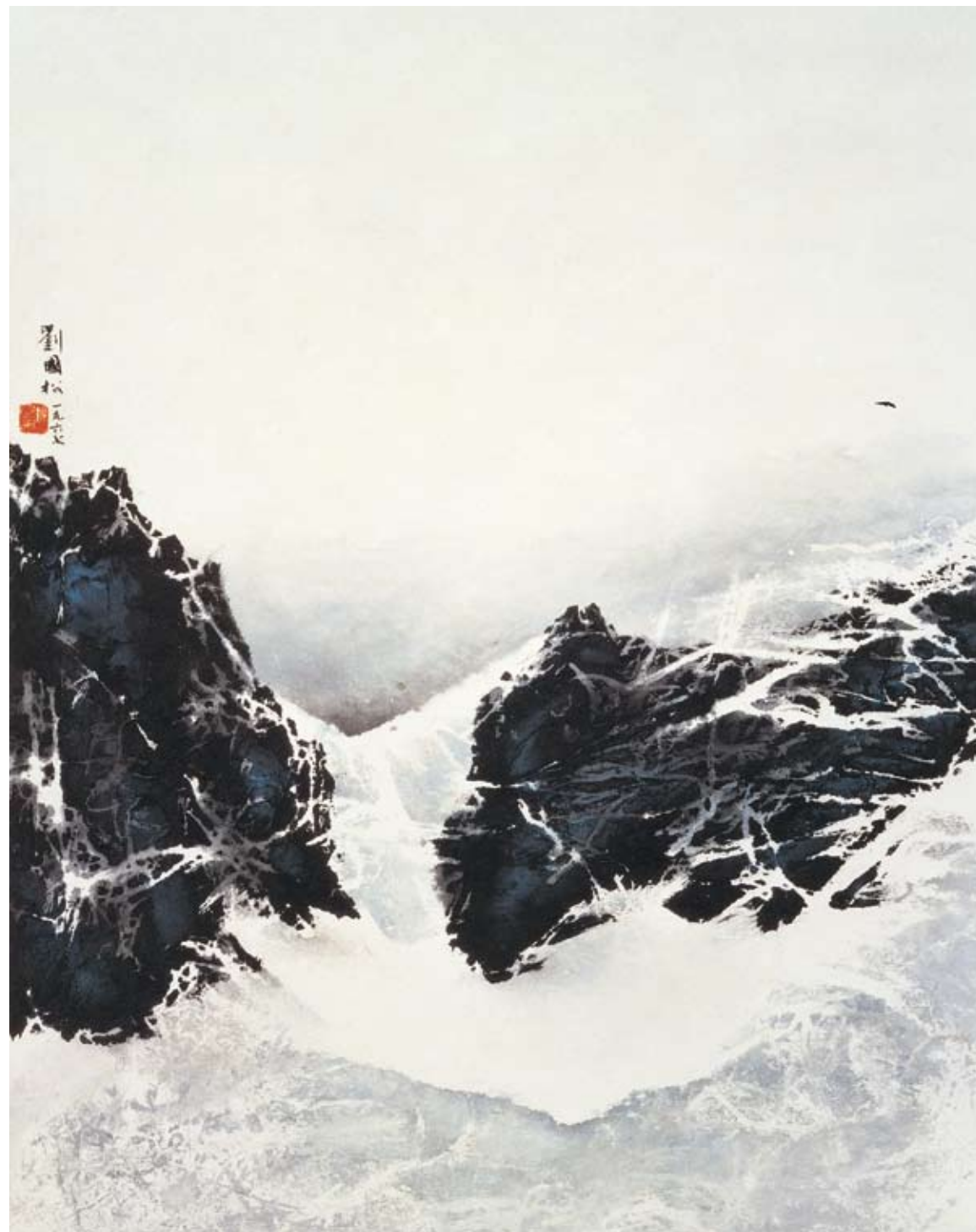
〔雪掩關山〕 1967，墨彩紙本，76.5×59.5 cm