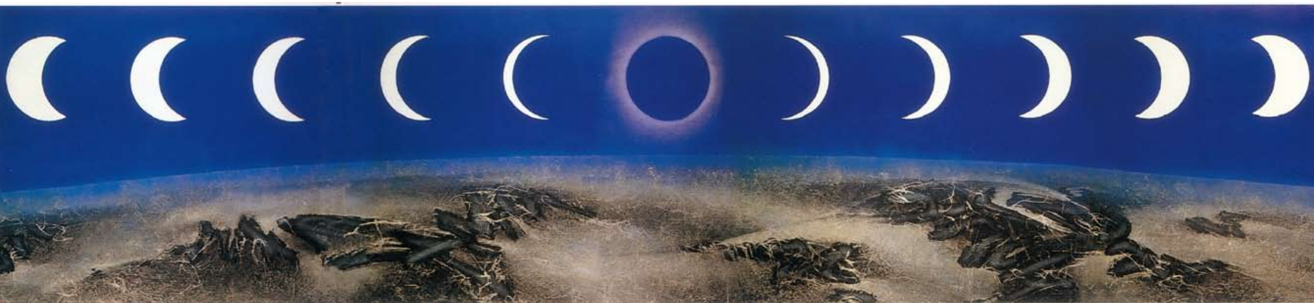
〔月蝕〕，1971，墨彩拼貼紙本，120×519 cm，私人收藏