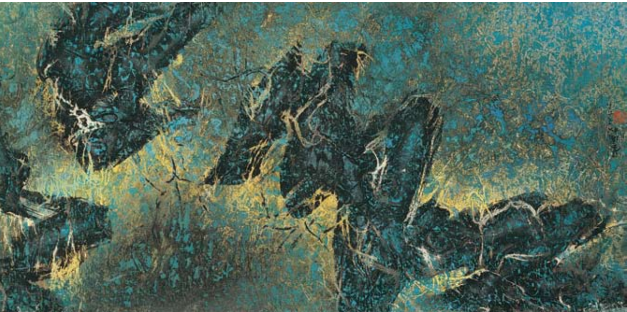
〔暮春草壑〕 1966，墨彩紙本，46×93 cm