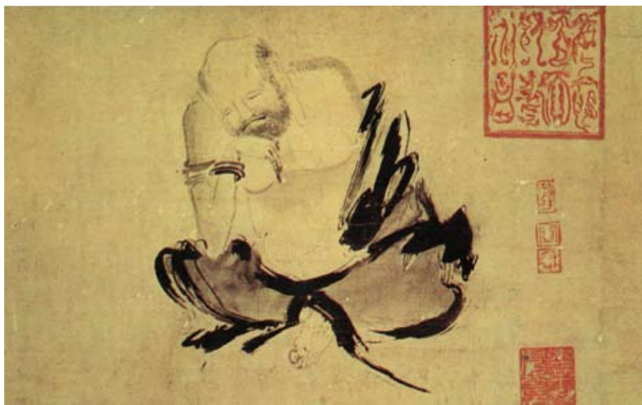
石恪〔二祖調心圖之一〕，五代後蜀，水墨紙本，35.5×129 cm 東京博物館藏

就像之前從中國傳統山水構圖中，取其神韻，留其構圖，去除山、水、樹、石的形象，形成純粹抽象的造型。現在，劉國松從石恪的「破筆」中，獲得啟發，以書法入畫，一如稍後梁楷的〔潑墨仙人圖〕，但去除老虎、禪師、仙人……的形象，獨存筆觸本身的美感，於是產生了〔五月的意象〕（1963）這樣的作品。